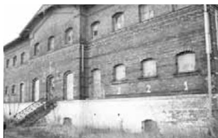
„Das Haus VIII“ Anfang der 90er Jahre, vormals Krankenstation, in der Erich Honecker eine Nacht verbracht hat

Seit Mitte Januar wird im Berliner Bezirk Lichtenberg mit dem neuen Gedenkort Rummelburg an die Verfolgten erinnert, die dort zwischen 1879 und 1990 unter verschiedenen politischen Systemen inhaftiert waren.