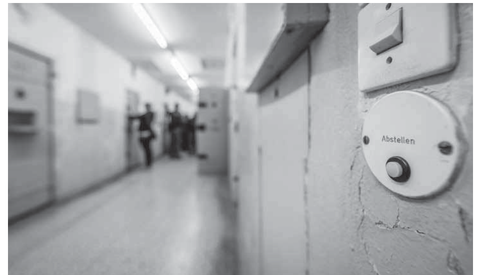
„Abstellen“ – In der Zelle warteten Untersuchungsgefangene auf ihre Vernehmungen

Dazu heißt es im Feedback der Studentinnen: „Wir haben eigentlich nur einen kleinen Verbesserungsvorschlag für die nächste Führung zu machen. Wenn Sie das Heft mit den Interviews und Fotos am Anfang zeigen, so können Gehörlose sich dieses nicht angucken und gleichzeitig die Informationen mitbekommen, die Sie gerade erzählen. Gehörlose können ja nicht parallel weiter zuhören wie Hörende das können.“ Genau das hatte ich nicht bedacht. Ich war hier fälschlich von „normalen“ Verhältnissen ausgegangen. Aber während „normale“ Besucher einen Text lesen und gleichzeitig einem Referenten zuhören können, müssen sich Gehörlose immer auf die Gebärden des Dolmetschers konzentrieren – deshalb habe ich jetzt ein paar Seiten aus meiner Punk-Broschüre kopiert und verteile sie