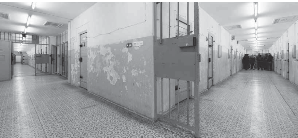
Gehörlose Besucher im ehemaligen Zentralen Untersuchungsgefängnis des Ministeriums für Staatssicherheit

Die „normalen“ Besucher von öffentlichen Führungen bilden ja ein breites Spektrum: Es gibt die Zurückhaltenden, deren Blick man aber ansehen kann, dass sie alles, was man sagt, aufmerksam verfolgen. Dann die, die zu jedem Satz des Referenten heftig nicken, aber schließlich Fragen stellen, aus denen hervorgeht, dass sie gar nicht zugehört haben; andere wieder suchen nie Blickkontakt, sondern sehen sich um, entfernen sich manchmal sogar kurz von der Gruppe.