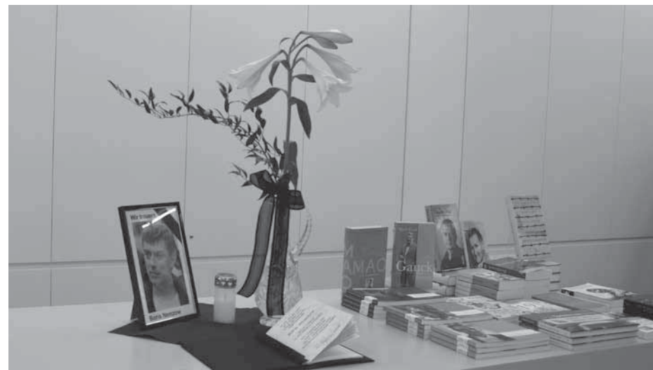
Stilles Gedenken. Kondolenzbuch für Boris Nemzow