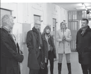
EVP-Politiker zu Besuch in der Gedenkstätte