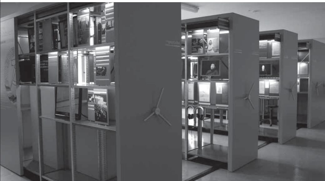
Wanderausstellung der Gedenkstätte: Hier haben Täter und Opfer der DDR-Diktatur ein Gesicht

Mitte November wurde in der Aula des Melanchthon-Gymnasiums im Berliner Bezirk Marzahn-Hellersdorf die begehbare Wanderausstellung „Gewalt hinter Gittern – Gefangenemisshandlungen in der DDR“ eröffnet. Sie ist ein Projekt der Gedenkstätte Berlin-Hohenschönhausen und zeigt auf sehr realistische und gerade deshalb erschütternde Weise, wie das SED-Regime in der DDR mit oppositionell eingestellten oder einfach auch nur andersdenkenden Menschen umging. Auf meine Anregung, auch als langjähriges Mitglied der hiesigen Bezirksverordnetenversammlung, wurde diese Ausstellung erstmals in einer Schule gezeigt. Schulleitung