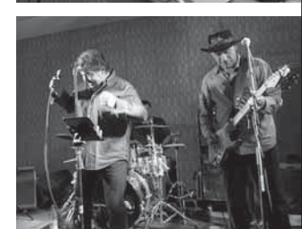
Da wurde abgerockt. „Speiches Monokel“ in der Gedenkstätte