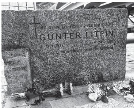
Gedenken an Günter Litfin, dem ersten Opfer des Schießbefehls in Berlin – elf Tage nach dem Mauerbau im August 1961